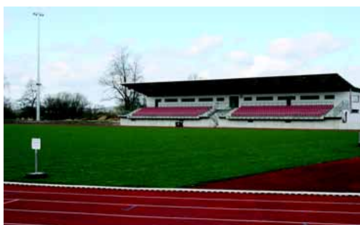
Ein Sport- und Leistungszentrum, das weit und breit seines gleichen sucht: Wetzlars „neues“ Domblick-Stadion

In diesen Tagen wartet die Verantwortlichen im Rathaus auf einen in Aussicht gestellten Bewilligungsbescheid des Landes Hessen, damit im Herbst am Klosterwald ein neuer Kunstrasen installiert werden kann.