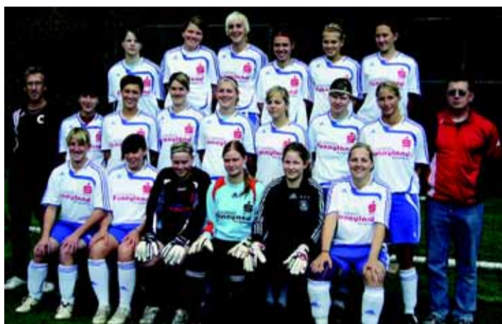
Sportliche und sehenswerte Mädels: Die Braunfelder Fußballerinnen.

geben wird. Sobald wir offiziell vom Verband den positiven Bescheid zu unserem Antrag erhalten, werden wir umgehend mit der Planung einer entsprechenden Veranstaltung beginnen, die allen Mitgliedern wie auch der Öffentlichkeit die Möglichkeit bieten wird, das neue "weibliche"