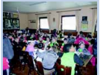
Impressionen vom Talenttag und dem ersten Feriencamp