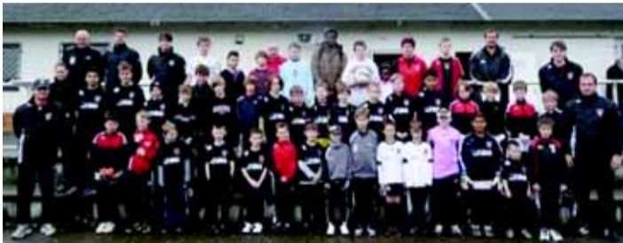
Talentierte Nachwuchsfußballer aus Wetzlar und Umgebung

Für die Sommerferien hat sich die Fußballschule Eintracht Wetzlar etwas Besonderes einfallen lassen: In jeder Ferienwoche wird ein Camp mit Torwart- und Positionstraining angeboten. Zusätzlich gibt es wie immer eine attraktive Grundausrüstung mit Einkaufsgutscheinen im Sportgeschäft. Für Geschwister, Gruppen ab fünf Teilnehmern sowie Teilnehmern, die zwei oder mehr Wochen buchen, gibt es erhebliche Preisnachlässe. Nähere Informationen zu den Fußballcamps sowie die entsprechenden Anmeldeformulare finden sich auf der Homepage von Eintracht Wetzlar unter www.eintracht-wetzlar.de sowie der Homepage der Fußballschule unter www.fussballschule-eintracht-wetzlar.de