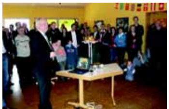
Eintracht-Sponsoren im Wetzlarer Albert-Schweitzer-Kinderdorf.