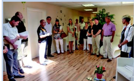
Praxisklinik Dr. Wilfried Herr (ganzheitliche Medizin)

Bei einem Rundgang durch die moderne, helle, lichtumflutete und mit warmen Tönen ausgestattete Praxis konnten sich die Besucher von der sehr guten Konzeption überzeugen, die bis ins Detail wichtige Fragen regelt. Ein Imbiss auf der Sonnenterrasse bei herrlichem Wetter rundete einen gelungenen Besuch des Finanzbeirates ab.