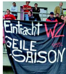
Eintracht Wetzlar - Fan-Gruppe

Mit drei Turniersiegen und dem Double kam die Eintracht in der vergangenen Spielzeit auf sage