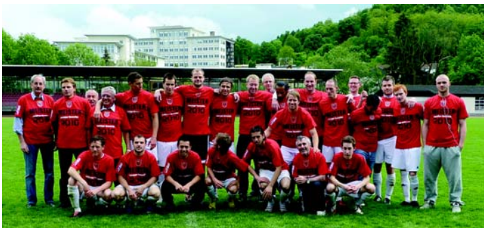
Meister und Pokalsieger

Die Eintracht präsentiert sich ihren Anhängern anlässlich des Tags der offenen Tür am 18. Juli am Klosterwald, darüber hinaus beim VOBA-Cup vom 20. bis 24. Juli im schmucken Domblick-Stadion an der Lahn.