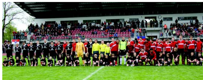
1. FC Kaiserslautern und Eintracht 05 Wetzlar vor der neun Tribüne im Wetzlarer Stadion

(fc). Alles für den guten Zweck: In diesem Fall für die Erdbebenopfer auf Haiti, genauer gesagt für den Aufbau von zwei Schulen auf der Karibikinsel. Die beiden Aufsteiger 1. FC Kaiserslautern und Eintracht Wetzlar (in der zweiten Halbzeit ergänzt durch Akteure aus der mittelhessischen Region) jagten vor 1500 begeisterten Fans im fast fertigen Stadion dem runden Leder nach.